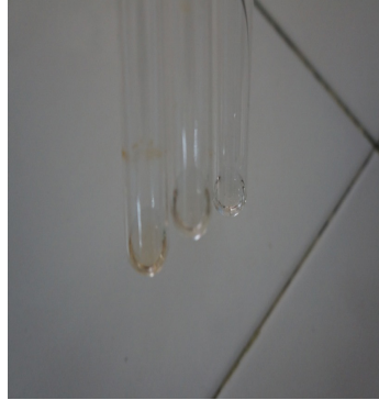
Gambar 2. Hasil skrining senyawa metabolit steroid sampel jantung pisang batu